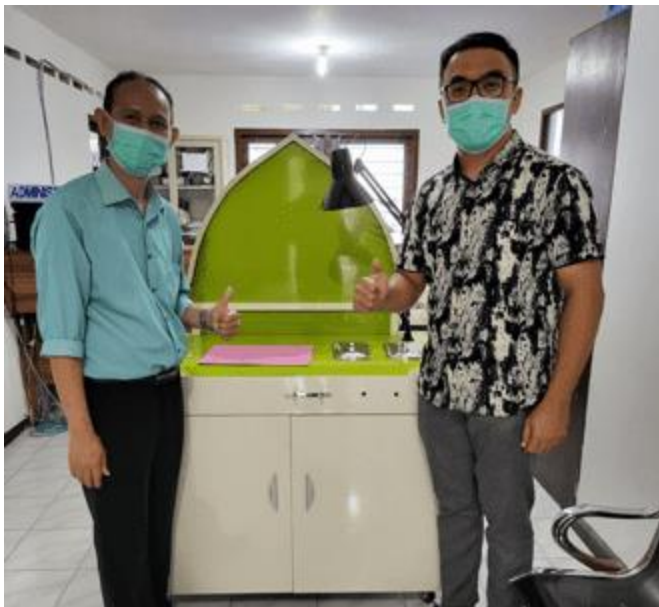
Gambar 3. Serah terima Smart ENT Unit , dari ketua tim peneliti kepada kepala klinik pratama Universitas Mataram

Penggunaan alat berbantuan mesin pintar akhir-akhir ini semakin marak digunakan, termasuk di bidang kesehatan, (Abundez Barrera et al., 2010; Alder et al., 2014; J et al., 2020) termasuk juga dalam bidang THT-KL (Verina, 2015). Hal ini sesuai dengan revolusi industri 4.0, dimana pelayanan THT-KL juga mengalami penyesuaian (Kadriyan, 2019).