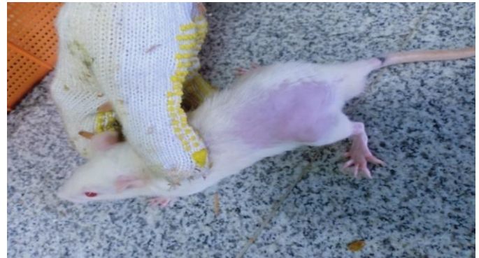
Gambar 5. Foto hari ke-14 tikus putih ( Rattus novergicus ). Luka sayat sembuh.