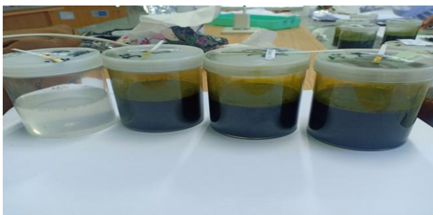
Gambar 3. Sediaan gel basis HPMC 3% dan gel ekstrak daun jarak cina ( Jatropha multifida ) konsentrasi 5, 10, 15%.