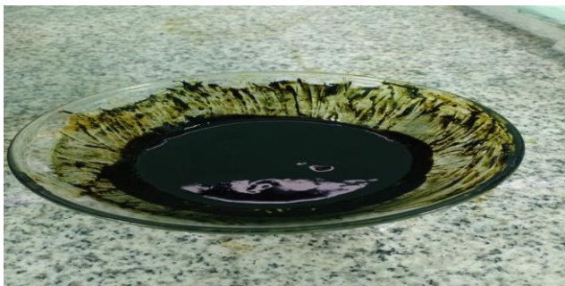
Gambar 2. Ekstrak Daun jarak cina ( Jatropha multifida )