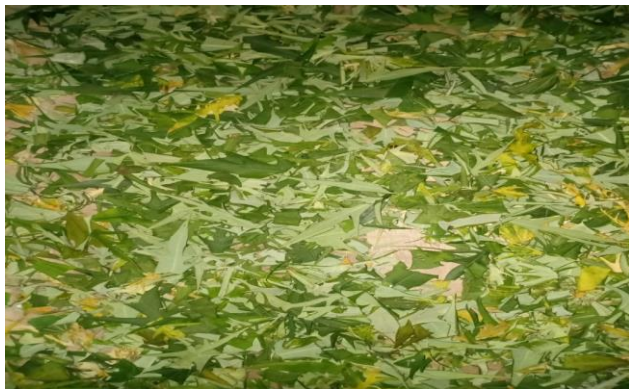
Gambar 1. Daun jarak cina ( Jatropha multifida )